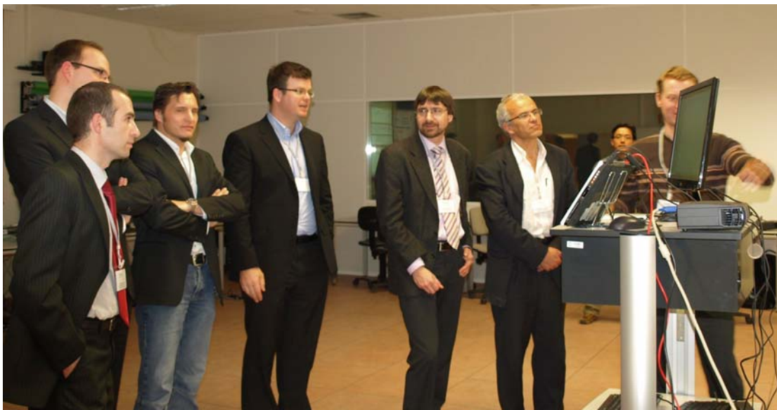
Auditoría del Proyecto CARMEN en la Universidad Carlos III de Madrid: Demostración 1

El proyecto CARMEN se compone de las siguientes organizaciones, representantes de los sectores público y privado: University Carlos III of Madrid , AGH University of Science and Technology , Alcatel-Lucent Deutschland AG , British Telecommunications PLC , Deutsche Telekom AG , Fraunhofer Gesellschaft Zur Foerderung DerAngewandten Forschung E.V. , NEC Europe Ltd. , University College Dublin , National University of Ireland, Dublin .