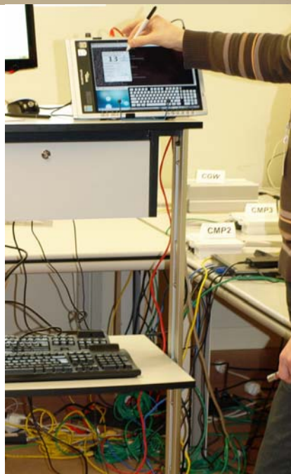
Auditoría del Proyecto CARMEN en la Universidad Carlos III de Madrid: Demostración 11-2-3